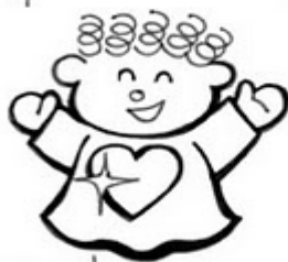
Los de Corazón Limpio