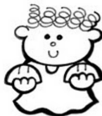
Los que aman la Justicia