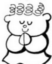
Los de espíritu de pobre