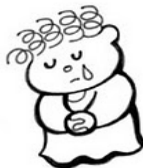
Los que lloran